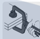
Tipo de sujeción