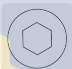
Entrada para llave allen