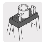
Meseta plástica con ranura para herramientas