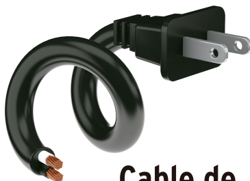
Cable de uso rudo