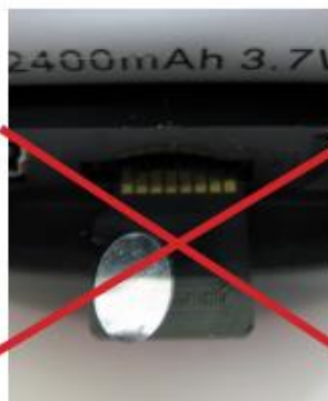
Errado o cartão SD está ao contrário