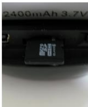
Passo 2: cartão SD parcialmente inserido na ranhura

4. Quando o cartão SD é inserido corretamente, irá ver algo semelhante à imagem abaixo.