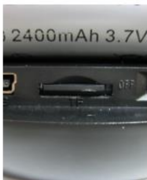
Este cartão SD está correctamente inserido