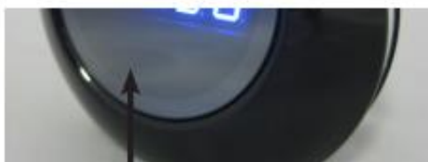
Luz de estado azul