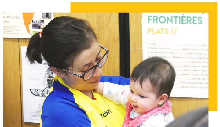
Participant de Saveurs Sans Frontières, 2019