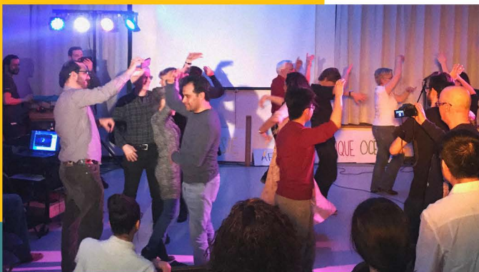
Lundi Québécois "Diversité au Québec", 2018

• Les ACF permettent aux participants d'en apprendre plus sur le Québec et sa culture en lien avec les thématiques des Ateliers.