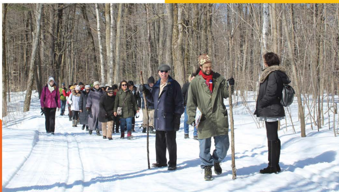
Sortie Cabane à Sucre, 2018

• Bien que le rôle de coordonnateur/trice de programmes ou de projets soit plus en gestion de projets/programmes qu'en intervention, tous consacrent une partie importante de leur travail sur le terrain à accueillir jeunes, parents, mamans, adultes, et créent des liens significatifs avec eux.