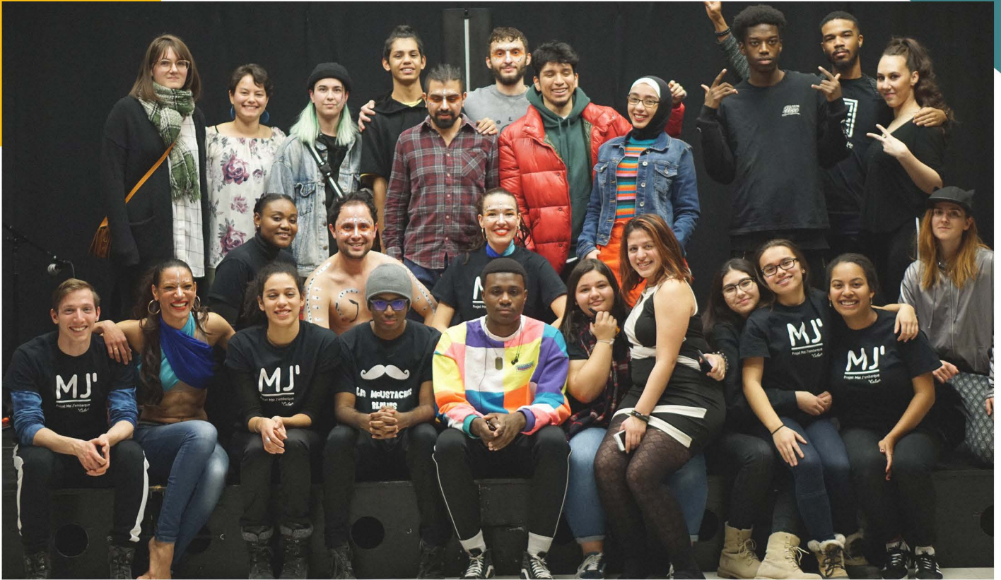
Exposé Ton Quartier, Projet MJ', 2018