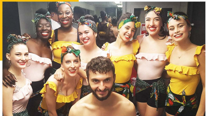
Programme Jeunesse, 2018

• Au programme adultes, plusieurs activités (chorale, espagnol conversation) génèrent la création de liens entre les participants qui se rencontrent avant ou après leurs activités pour socialiser, partager, échanger.