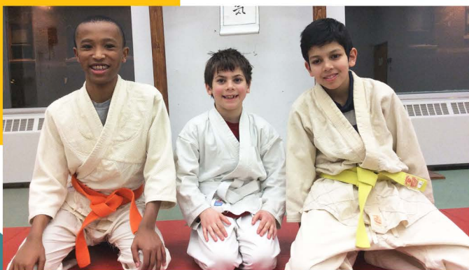
Aïkido au Dojo du Celo, 2019