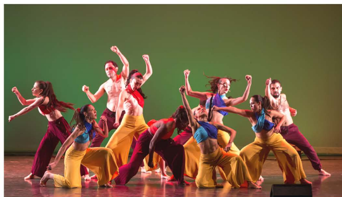
Danses Afrolatines à Celo en Spectacle, 2018

En 2018-2019, les Lundis Québécois ont vu augmenter le nombre d'inscriptions passant de 149 à 179 inscriptions provenant de 20 PAYS DIFFÉRENTS.