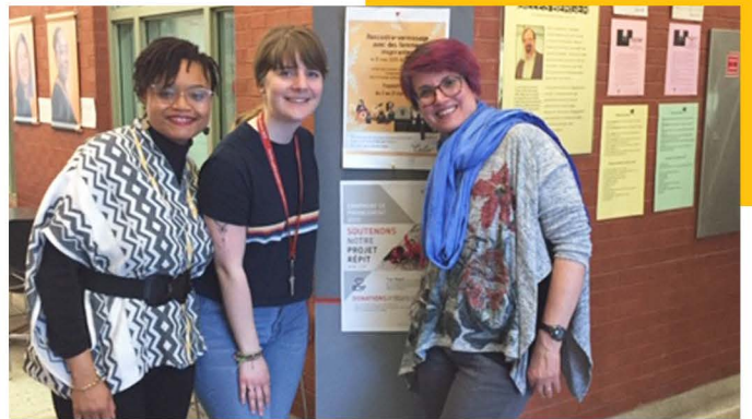
Exposition avec Femmes du Monde et Noor, 2019

• Le projet Répit favorise aussi la création de liens à travers les fêtes qu'il organise avec les familles des enfants accueillis, notamment la fête de Noël ou celle de fin d'année.