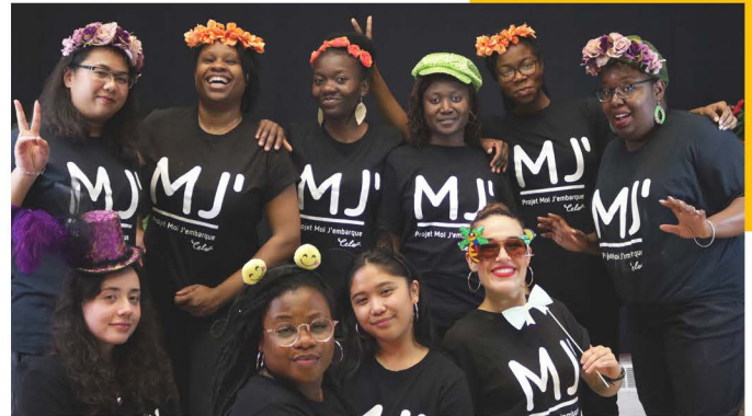
Équipe Moi J'embarque, 2018

- L'engagement des aînés a permis d'initier dans le cadre du programme Cel'OR. un premier projet d'une grande envergure, la Soirée Autour du Piano Public, événement que l'on souhaite voir devenir mensuel où l'on prolonge la vie des pianos publics de Côte-des-Neiges mais à l'Intérieur du Celo.