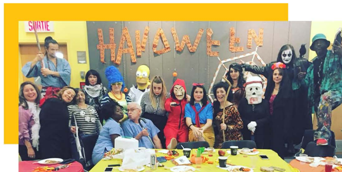
L'équipe en mode Halloween, 2018