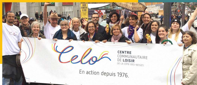
L'équipe à la Marche Centraide, 2018

Halte garderie Ateliers Croquignoles Activités Parents enfants Soutien aux familles Représentation: Table de concertation Famille CDN