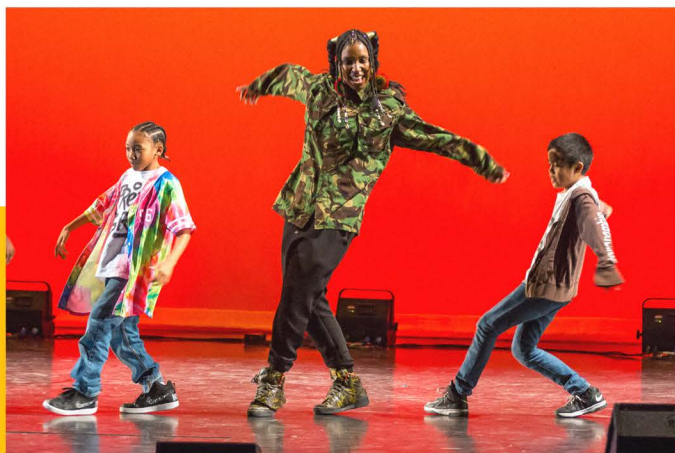
Hip-Hop 9-11 à Celo en Spectacle, 2018

Nous avons établi les bases d'une meilleure collaboration entre l'organisation des Ateliers de conversation française et du Parlons français (objectifs et fonctionnement entre stagiaires définis) pour augmenter les occasions d'immersion francophone, un réel défi pour les allophones de Montréal.