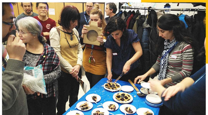
Lundi Québécois: Lac Saint-Jean, 2018

L'adaptation est au cœur même de nos pratiques pour répondre à la mission. Cette année, les éducatrices de la halte-garderie les Croquignoles ont adapté leurs horaires et leurs tâches en permettant d'intégrer des jeunes dont les parents fréquentent un centre de francisation du quartier.