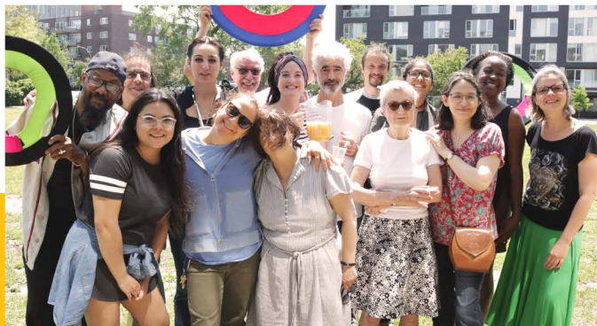
Pique-nique employés & bénévoles, 2018

Employés réguliers, saisonniers à temps plein ou partiel, ils animent les activités et font fonctionner le Celo.