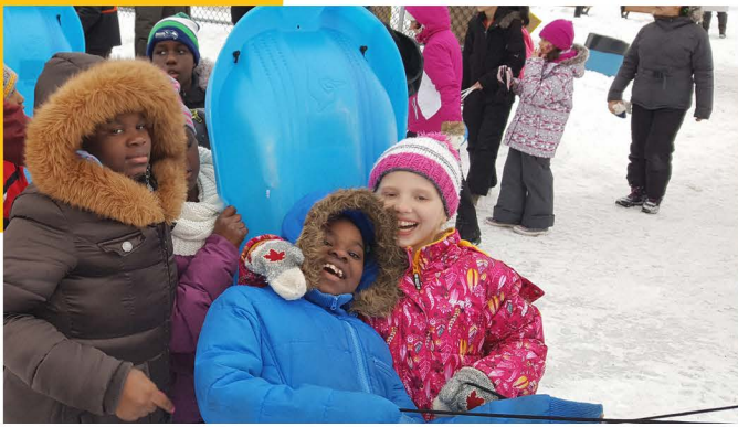
Le Répit à "Hiver en Fête", 2018