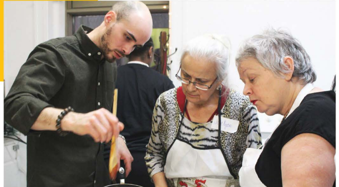
Atelier Ta Cuisine 2, Projet MJ', 2018