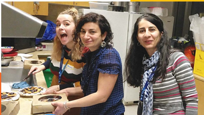
Stagiaires au Lundi Québécois, 2018

• Aux ateliers Croquignoles toutes les places ont été comblées. Dans un contexte où la concurrence dans l'offre en milieu de garde est de plus en plus nombreuse et diversifiée,