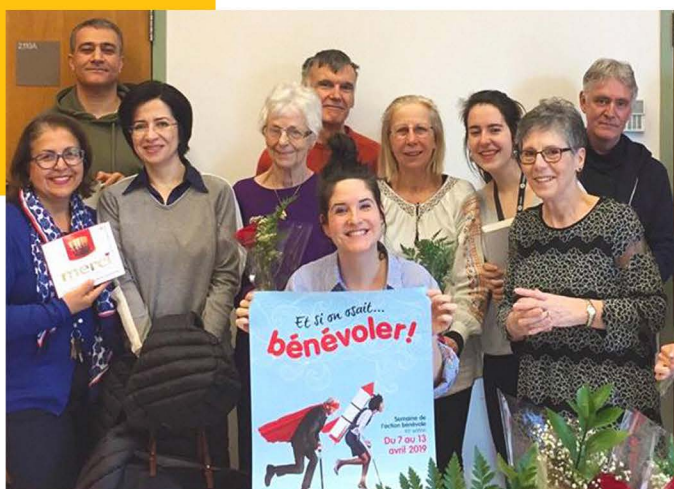
Semaine de l'action bénévole, 2019

Tous les bénévoles apportent généreusement leurs compétences et leur passion au service du Celo et de ses participants.