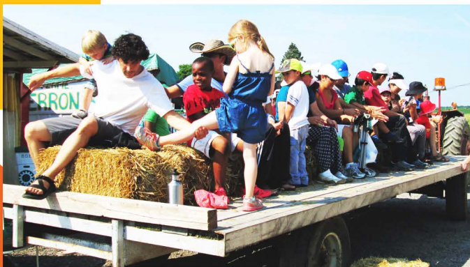
Cueillette de fraises, Programme Famille

• Les expositions de l'espace Gilles-Berger permettent de diffuser les œuvres d'artistes locaux, ou à travers des collaborations comme celle avec le Festival du Bonheur par le biais de son exposition : «Le bonheur d'ici», de faire connaître l'action d'associations qui interviennent autour de projets sociaux et communautaires. La démocratisation et l'accessibilité aux arts visuels représentent des éléments porteurs pour permettre aux membres du Celo exposant de s'exprimer et de communiquer leur passion, intérêts et opinions et à nos membres de les découvrir.