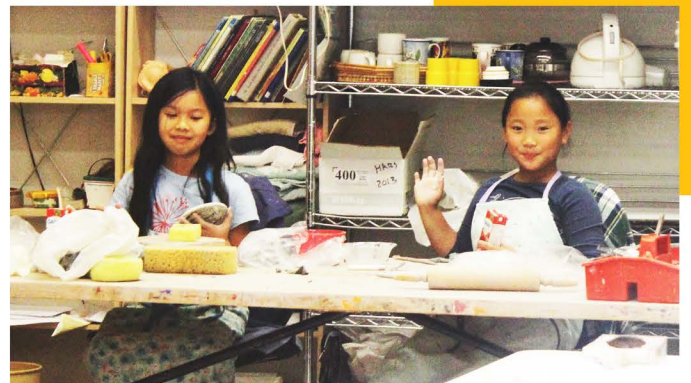
Cours de Céramique, Programme Enfants

La création de cours de cuisine et de céramique le dimanche et d'un cours de soccer supplémentaire le samedi a rencontré un vif succès.