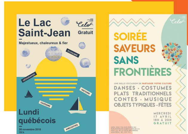
Affiches événements Celo, 2019