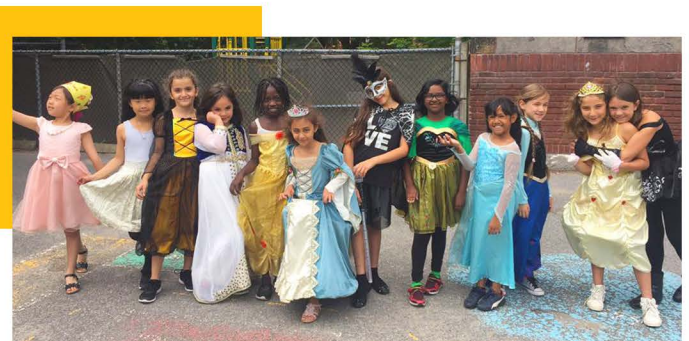
Camp de Jour, 2018