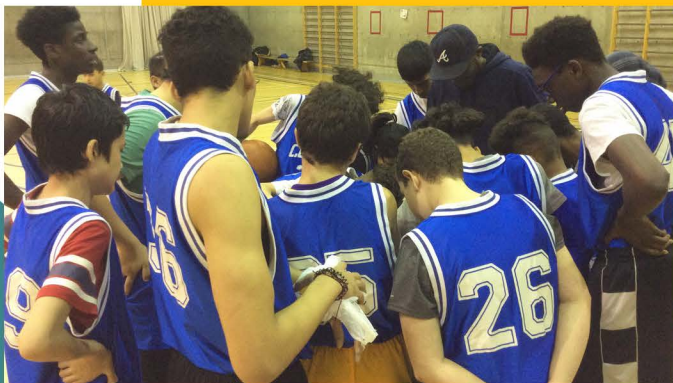
Équipe de Basketball Jeunesse, 2018

- Le bénévolat est aussi un temps privilégié de l'empowerment. Cette année notamment la création de l'instagram, le Tricot solidaire pour le Celo ou même le jardinage d'embellissement et l'entretien de l'allée en sont de beaux exemples.