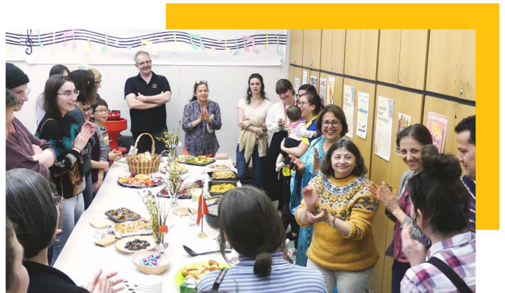
Saveurs Sans Frontières, 2019

• Le programme adultes est en lui-même un programme intergénérationnel puisqu'il accueille dans la plupart de ses cours 3 générations qui se côtoient en pleine harmonie.