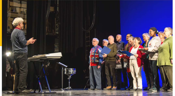
Chorale adultes à Celo en Spectacle, 2018

- Bilan, échanges et consultation étaient au rendez-vous, en organisant Les coulisses des Lundis québécois (LQ) en juin 2018, où les participants étaient invités à découvrir l'organisation des LQ et à donner leur avis pour les améliorer. C'est à ce moment, que l'on considère avoir fait plusieurs bons coups. D'abord nous avons récolté de bonnes pistes pour orienter les LQ 2018-2019 (thèmes, améliorations à apporter, réflexion sur la culture québécoise). Ensuite, nous avons réussi à motiver plusieurs participants à s'impliquer dans l'organisation des LQ de l'année suivante. À l'automne, avec le noyau de bénévoles déjà bien fidèles aux LQ, nous regroupions une quinzaine de bénévoles d'origines diverses (7 pays différents) auxquels se joignaient 4 stagiaires. À noter aussi, l'engagement de trois bénévoles passionnés de technique, qui ont apporté un rendu visuel beaucoup plus liché et attrayant aux LQ (éclairage, son et montages vidéo). En terme de milieu de vie rassembleur, harmonieux et participatif c'était très réussi.