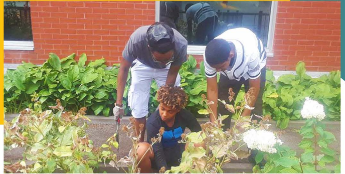
Jardinage au Celo, 2019