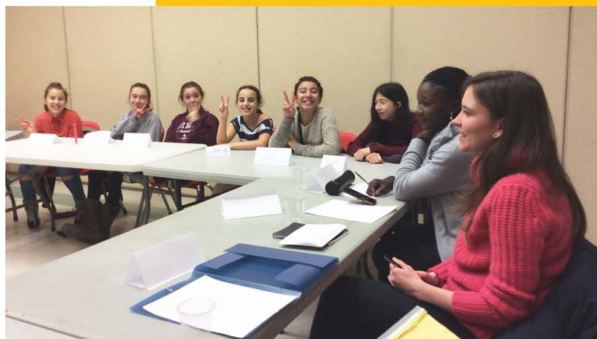
Rencontre Comité Gouvernance et Ados, 2018

• Au-delà des employés de l'accueil, les coordonnateurs de programmes sont intervenus directement à l'accueil, proposant une intervention personnalisée auprès de personnes vulnérables ou simplement, en accompagnant personnellement des membres.