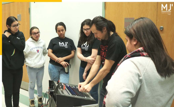
Formation Son: Projet Moi J'embarque, 2018

l'on pourrait qualifier de «passerelles» (10-13 ans, 12-18 ans, 18-25 ans) sont favorisées. Enfin, le bénévolat et le rapprochement interculturel sont des programmes transversaux qui accueillent des participants jeunes comme adultes. Nous offrons une programmation de loisir variée et accessible et l'avons fait en 2018-2019. En complément à cette programmation, nous offrons aussi des activités ponctuelles, organisons des événements et encourageons l'action communautaire.