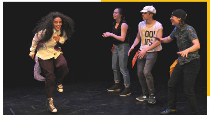
Spectacle Programme Jeunesse, 2018

• Le programme Loisir jeunesse œuvre à la création d'une communauté artistique notamment autour de la danse urbaine. Ainsi, les jeunes ont une porte ouverte non seulement pour connaître le monde de la danse en dehors du Celo, mais aussi pour aborder les compétitions au Celo, à Montréal, à l'échelle de la province et du Canada.