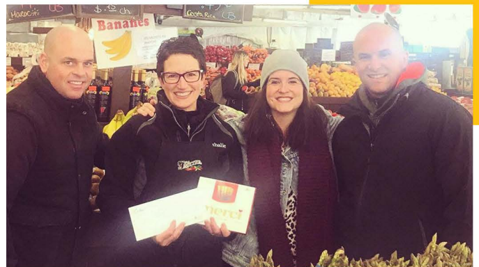
Collaboration avec le Marché Trottier, 2019

- La Semaine d'action bénévole du 7 au 14 avril fut une belle complicité de quartier avec le marché Trottier qui nous a donné 100 arrangements de roses que nous avons pu remettre à nos précieux bénévoles. J'ai également installé une grande banderole sur un mur au Celo afin que les gens puissent laisser un petit mot ou un merci aux bénévoles. Cela met de la couleur et de la vie!