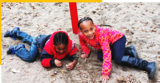
Participants du Projet Répît