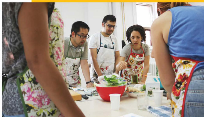
Atelier Culinaire "Ta Cuisine", Projet MJ', 2018

Comme plusieurs autres OBNL, le Celo voit ses capacités financières diminuer au fil des ans, tandis que ses obligations et responsabilités augmentent et qu'il doit harmoniser ses pratiques aux nouvelles réalités. Pour ce faire, à l'hiver 2019, un consultant a accompagné l'équipe de direction dans l'actualisation de tous ses outils de gestion des ressources humaines. De cet exercice, nous en sommes ressortis avec une politique complète de gestion des ressources humaines et tous ses formulaires. Beaucoup de travail avait été fait auparavant, mais cet accompagnement a permis de tout harmoniser. Dès que la politique sera adoptée par le conseil d'administration, nous passerons à l'étape suivante et à sa mise en œuvre.