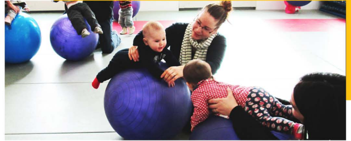
Ateliers Croquignoles, Programme familles

la responsable du programme petite-enfance/ familles a su relever ce défi en créant des liens avec des familles souvent nouvellement arrivées au Québec et en leur apportant du support dans leur installation dans un nouveau pays et une nouvelle culture.