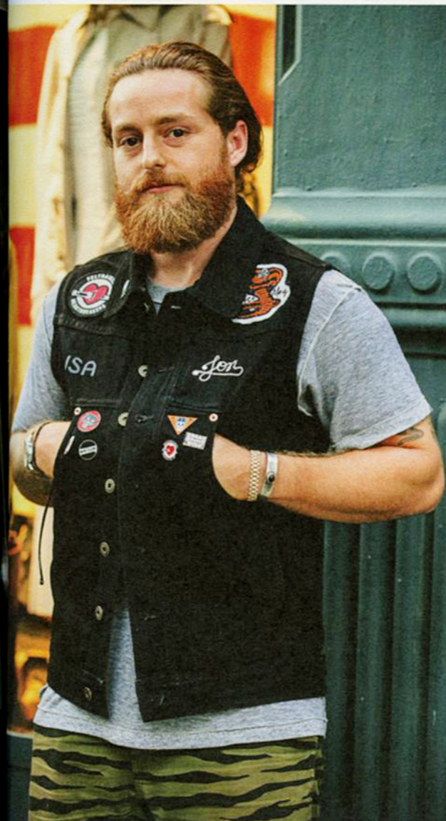
Shot in New York, U.S.A.

チェーンステッチやペイント、そ れにバッジやワッペンなどでデコ レートしたベストはシンプルなT シャツに合わせるのが正解。都会 的なバイカーらしいスタイル