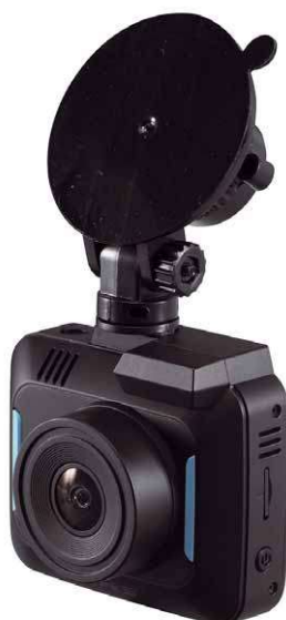
Die Aufnahme erfolgt auf MicroSD