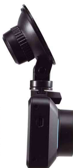
Stromversorgung und Datentransfer über USB-C