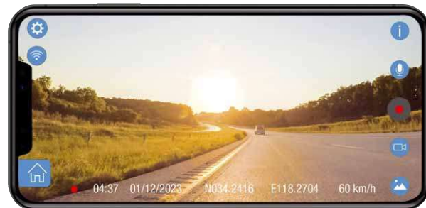
Anzeige und Steuerung per App