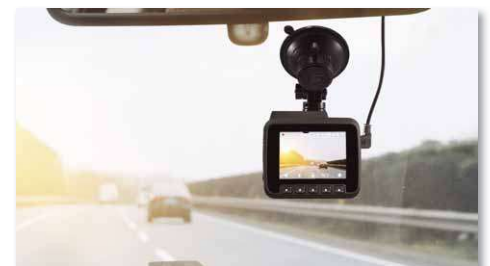
Stromversorgung über den Zigarettenanzünder