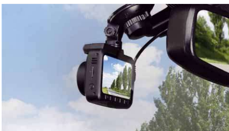
Die kleine Cam braucht wenig Platz

auf MicroSD-Karte. Ist die Karte voll, so werden die ältesten Videos automatisch überschrieben und damit gelöscht. Denn in Deutschland ist die anlasslose dauerhafte Videoaufnahme im öffentlichen Raum aus Datenschutzgründen nicht erlaubt. Zum Lieferumfang der 4K gehört eine 16 GB MicroSD, bei Bedarf können Speicherkarten bis 128 GB verwendet werden.