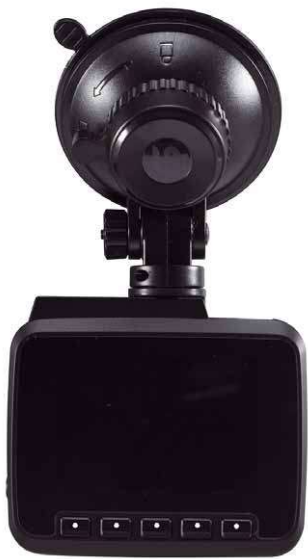
Die Cam wird über die fünf Tasten unterm Bildschirm gesteuert