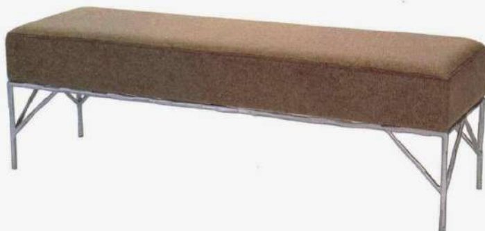
Banc en aluminium martelé et tissu. Bench in hammered aluminum and fabric. Design Kaki Kroener, Robin , 135 x 40 x 43 cm, ÉDITION MAISON POUENAT .