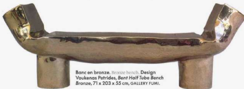
Banc en bronze. Bronze bench. Design Voukenas Petrides, Bent Half Tube Bench Bronze , 71 x 203 x 55 cm, GALLERY FUMI.