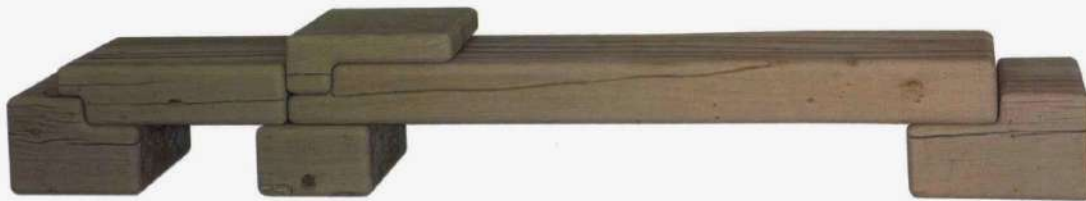
Banc en chêne. Bench in oak. Design Linde Freya Tangelder, Low Bench , 33 x 35 x 223 cm, CARWAN GALLERY.