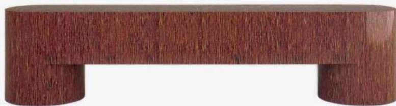
Banc en palmier brillant fait main. Handmade bench in glossy red palm wood. Design Francesco Balzano, EU/III , 200 x 40 x 45 cm, GALERIE KOLKHOZE.