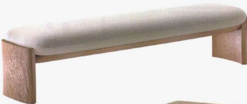
Banc en chêne massif naturel gougé et tapisserie. Bench in natural solid gouged oak and fabric. Design Pierre Yovanovitch, MAD Bench , à partir de 43 x 130 x 45 cm, PIERRE YOVANOVITCH MOBILIER.