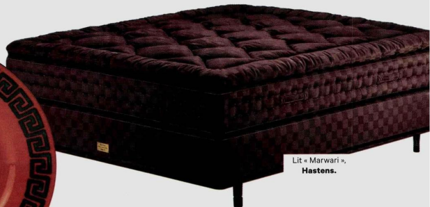
Lit « Marwari », Hastens .