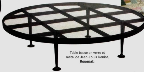
Table basse en verre et métal de Jean-Louis Deniot, Pouenat .