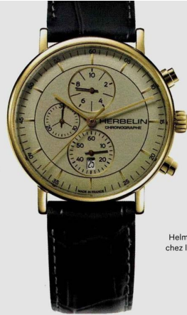
Montre « Inspiration » en or jaune, Herbelin .