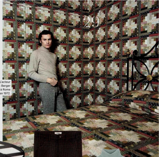
L'acteur Helmut Berger chez lui à Rome en 1972.