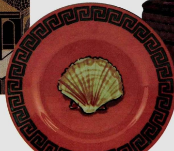
Assiette en porcelaine, Ginori 1735 .