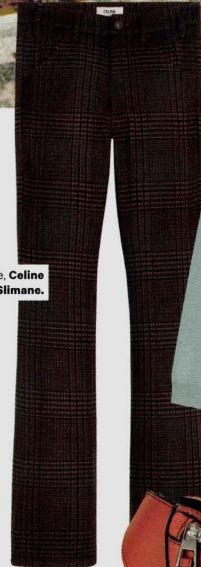
Jean en laine, Coline par Hedi Slimane.