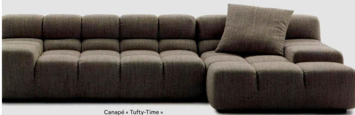
Canapé « Tufty-Time » en tissu, B&B Italia .