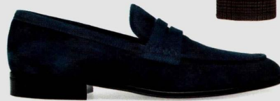
Mocassins en cuir suédé, Gianvito Rossi .