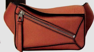
Mini-sac « Puzzle » en cuir, Loewe .