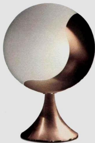
Lampe « Modèle N° 936 GM » en verre et métal, Jean Perzel .