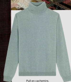
Pull en cachemire, Maison Montagut .