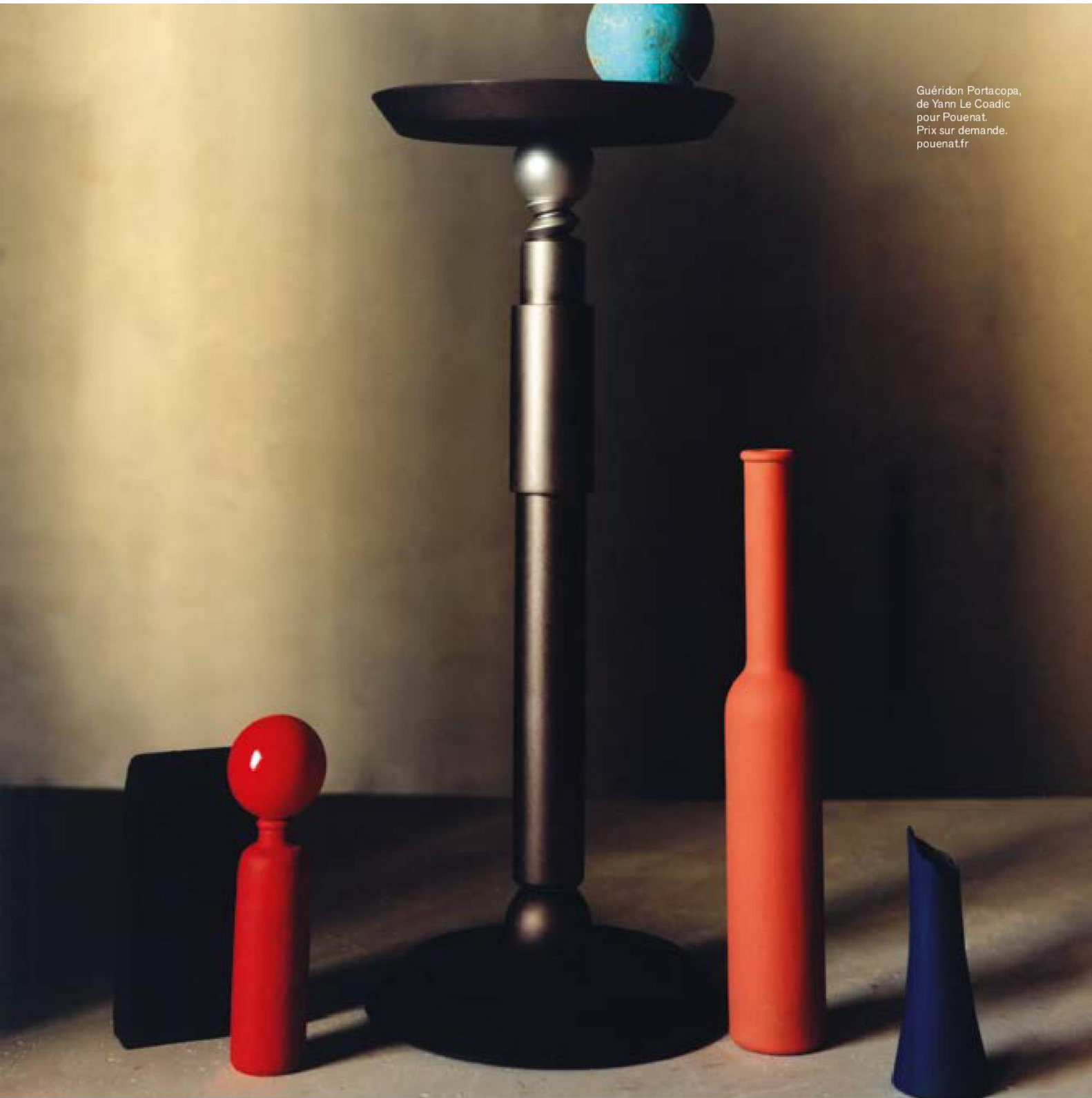
Guéridon Portacopa, de Yann Le Coadic pour Pouenat. Prix sur demande. pouenat.fr