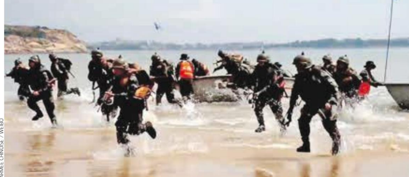
Au harcèlement aérien, l'armée chinoise ajoute la simulation d'une invasion de l'île démocratique. Le risque de guerre est jugé réel, car une dérobade de Washington reviendrait à laisser toute l'Asie dans l'orbite de Pékin. PAGES 12, 13 ET L'ÉDITORIAL