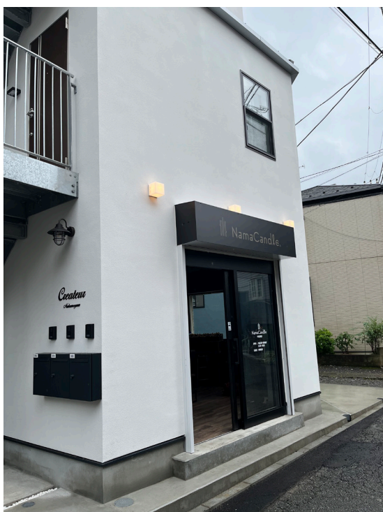
Nama candle 中目黒店 外観