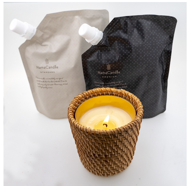
生キャンドルパック(奥左スタンダード/右プレミアム) 籐カップ(前)

市販されている多くのアロマキャンドルは、制作時にワックスと精油(香料)が混ざり合う瞬間に“最高の香り”が広がります。ただ、この香りを体感できるのは作り手だけで消費者は経験することができませんでした。生キャンドルは“その特別な香り”をご自宅で体感することが出来る商品です。作り立ての香りの強さは通常キャンドルの炎を灯して広がる香りに比べ3倍以上※になります。