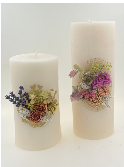
ワークショップ ブルーミングキャンドル