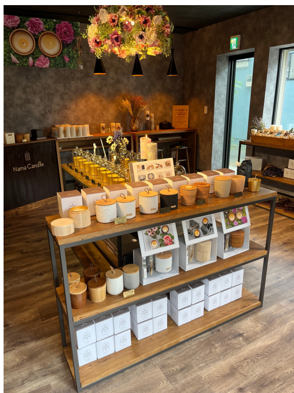
Nama candle 中目黒店 店内