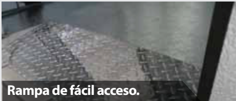
Rampa de fácil acceso.