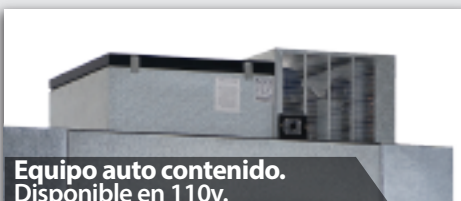
Equipo auto contenido. Disponible en 110v.