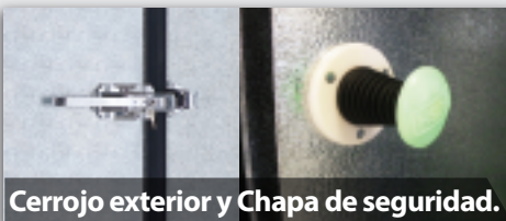
Cerrojo exterior y Chapa de seguridad.