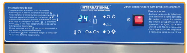
Indicador y sensor de temperatura.