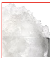
Hielo tipo frappé.