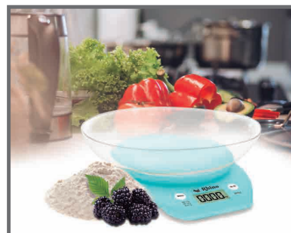
Incluye tazón desmontable

SERVICIO Y REFACCIONES DISPONIBLES Contamos con una red de centros de servicio en toda la república: rhino.mx/servicio.html