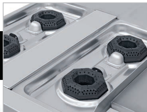
Cubierta semi-sellada evita derrames al interior.

f/coriat.sobrincox t/coriat YouTube/GrupoCoriat