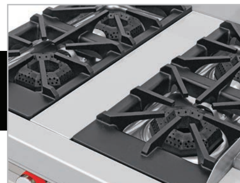
Robustas parrillas súper resistentes desmontables.