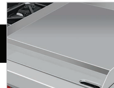
Plancha con exclusivo sistema recolector de grasa y residuos.