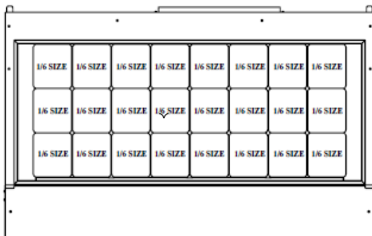
DISEÑO DE LA CHAROLA