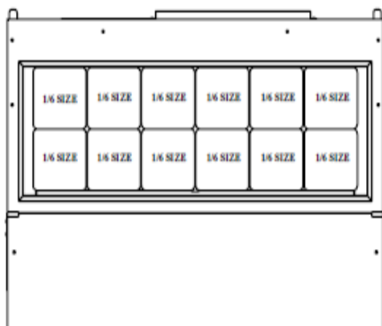
DISEÑO DE LA CHAROLA