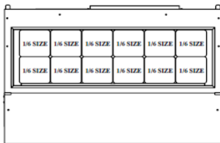
DISEÑO DE LA CHAROLA