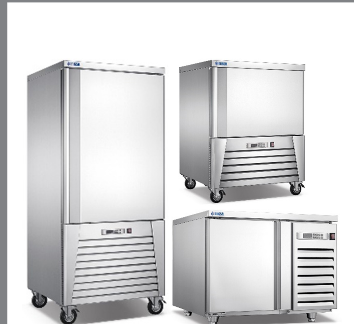
MODELOS BCF12 | BCF25 | BCF30

MAQUINARIA INTERNACIONAL GASTRONÓMICA, S.A. DE C.V. 📍 HENRY FORD 257-H, COL. BONDOJITO, ALC. G.A.M. 07850, CDMX. ☎ 5517.4771 | 5739.3423