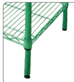
Fácil de Ajustar