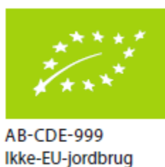
Figur 2. Mærkning med økologimærke med placering af kontrolnummer og Ikke-EU-jordbrug. Skal være med DK-ØKO-100 som tekst.

Forholdet mellem højde/bredde skal altid fastholdes. Derudover påføres kontrolkode og teksten "Ikke-EU-jordbrug" under logoet (se Figur 2)