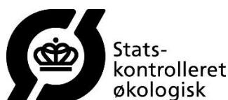
Figur 3. Dansk økologimærke i sort.

Derudover kan påsættes det danske økologimærke i sort – skal være med teksten Statskontrolleret økologisk (se Figur 3)