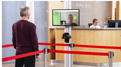
Software FLIR EST™ Desktop

FLIR Screen-EST™ Desktop es un software de detección para ordenador para las cámaras termográficas de las series FLIR T, FLIR Exx y FLIR Axxx. El software implementa herramientas de medición automática, como la detección de rostros y el muestreo promedio automático, que reducen a dos segundos el tiempo de detección para las personas. El rápido rendimiento de detección convierte a FLIR Screen-EST Desktop en la solución preferida para la detección en zonas de entrada, puntos de control y otras zonas muy concurridas, mientras se mantienen las normas de distanciamiento social recomendado.