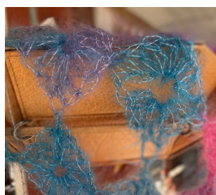
Strick und Glück 30.09 2023

Es besteht die Möglichkeit, sich die Stränge mit Haspel und Wollwickler im Laden zum Knäuel zu wickeln.