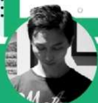
Ayu (PCM) 副總編輯

● 加入聚光燈補光後，可提供彩色夜視畫面，較近距離會更清晰，但較遠距離會不及紅外線模式。