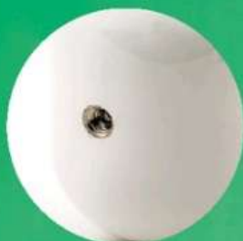
● 亦可使用螺絲孔固定位置。