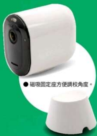
● 磁吸固定座方便調校角度。

鏡頭需配合 Arlo Secure 訂閱，才能發揮全面功能，隨機只附送首三個月服務，之後需要額外付費，否則只用到即時視訊串流及動作通知功能。Secure 訂閱方案可儲存最多 30 日影片歷史記錄，並提供人員、快遞包裹、車輛和動物偵測，以及動態偵測區域等功能。以往 Arlo 的 USB 或記憶卡插槽設於基座，今代 Arlo Pro 4 同樣如是，若要使用儲存裝置錄影，就需要額外花錢購買基座了。