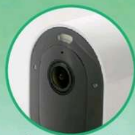
● 加入白色聚光燈，提供彩色夜視功能。