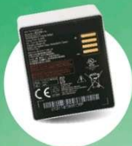
● 4,800mAh 電池可拆下更換。