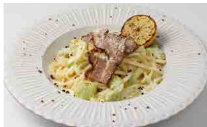
ベーコンとそら豆のレモンクリームパスタ

ベーコンとそら豆のレモンクリームパスタ (サラダ、スープ付き) 1,300 ~焦がしレモン添え~ (税込価格 1,430)