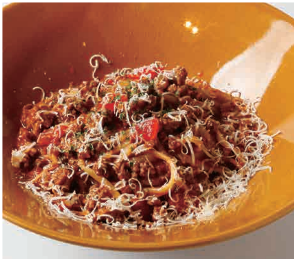
白トリュフ香るボロネーゼ

ブレンドコーヒー(ホット、アイス)/紅茶(ホット、アイス)/オレンジジュース/ モクテル(シンガポールオレンジフィズ、タイムピンクグレープフルーツブモーニ、シトラスカルダモン)