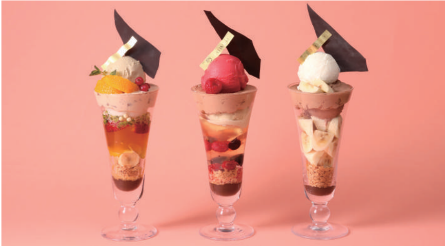
ロイヤルフルーティー ラズベリーピスターシュ ダムブランシュ