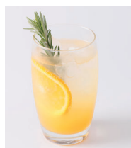
シンガポールオレンジ フィズ