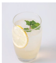
シトラスカルダモン フィズ

Mocktail = モクテル: 「mock (モック)」と 「cocktail (カクテル)」を組み合わせた造語。 ノンアルコールカクテルの新しい名前です。