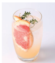
タイムピンクグレープ スプモーニ