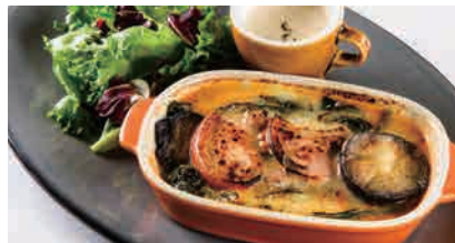
なすとほうれん草のラクレットチーズラザニア