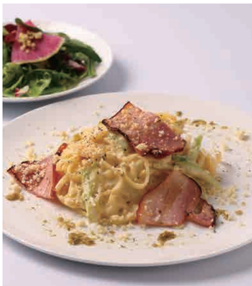
燻製ベーコンと柚子のカルボナーラ