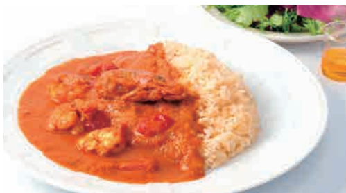
海老カレー～エビバターライス～