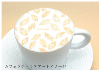
カフェラテ・ラテアートイメージ