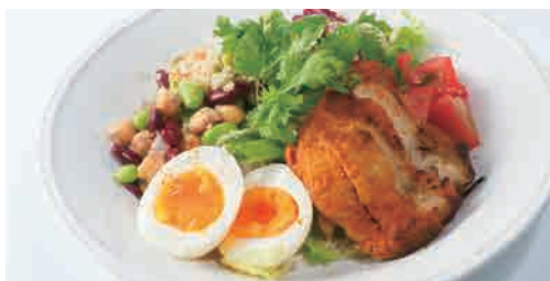
タンドリーチキンのコブサラダ