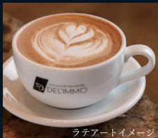
ラテアートイメージ