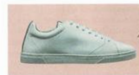
La sneaker entièrement recyclée de OTH x FRBG.

Pape de la sneaker, Kanye West a présenté sa dernière sneaker au Fast Company Innovation Festival : la Yeezy Foam Runner. Comme son