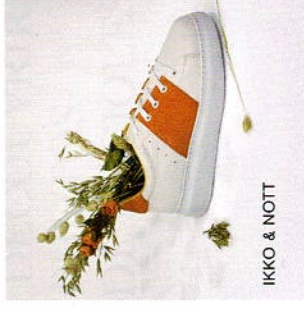
IKKO &amp; NOTT