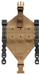
Rückseite; Beispiel. Kompatibel mit untersch. Montagen