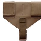
2. Range Belt Mount (hinten)