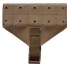
3. MOLLE Mount Mount (hinten)