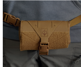
Vorderseite; am Körper; als solo Bauchtasche