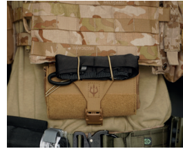
Montiert, mit Innen- teil; mit Schere & TQ durchs Shock Cord