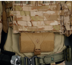
Montiert, ohne Schere & TQ