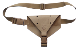
4. Fanny Pack Mount