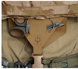
Montiert, ohne Innenteil; mit Schere durch Schleife