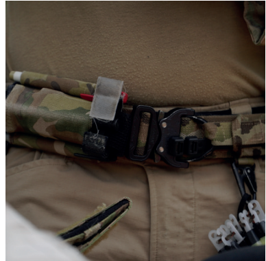
Range Belt, Inner Belt, STB (Tourniquet Holder), & mehr.

Diese und noch viele weitere Produkte findest du auf unserer Website