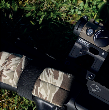
Two Point Sling und Sling Keeper