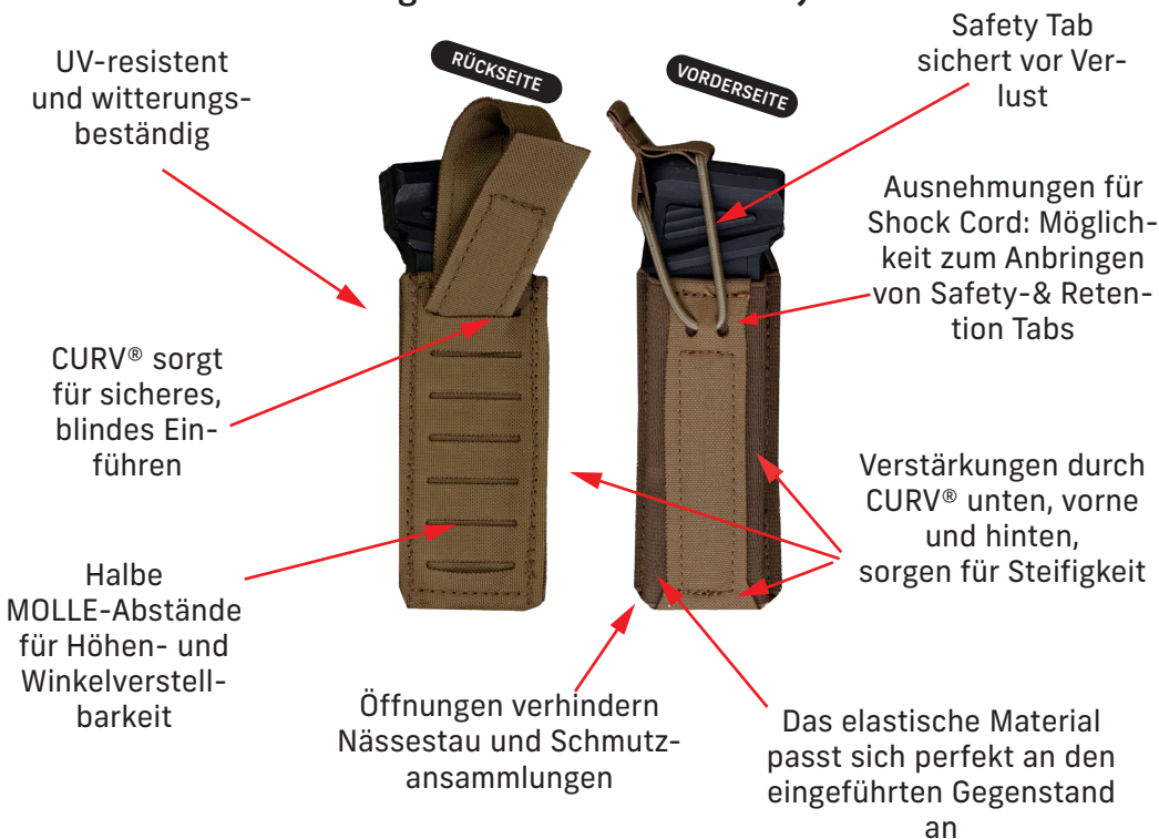
OMERTA Pistol Mag Pouch mit Safety Tab