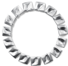
プラネターリセット・ラークソット ネックレス ¥515,000 (税込)

1969年のアポロ11号月面着陸にインスピレーションを受けたデザイナーのBjörn Weckströmによってデザインされたコレクション。「惑星の谷」という意味のPlanetaariset Laaksot (プラネターリセット・ラークソット) ネックレスは、1970年代にジョージ・ルーカス監督の映画「スターウォーズ」のエピソード4でレイア姫が身に着けたことで国際的な名声を得たアイコン的なジュエリー。