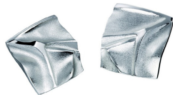
ゲロピアス ¥70,000 (税込)