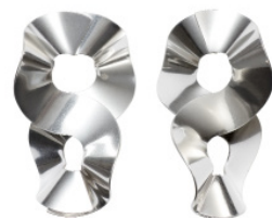
ラージシルバーピアス ¥63,000 (税込)