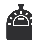
HORNO DE PIZZA