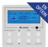
Thermostat filaire (XK-41)