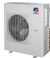
Condenseur 36 000 et 42 000 BTU/h