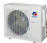
Condenseur 18 000, 24 000 et 30 000 BTU/h