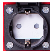
Dos tomacorrientes de 220V

C U M P L E C O N O S H A : Incluyendo salidas GFCI y más, este generador inversor está construido con las características que necesita.