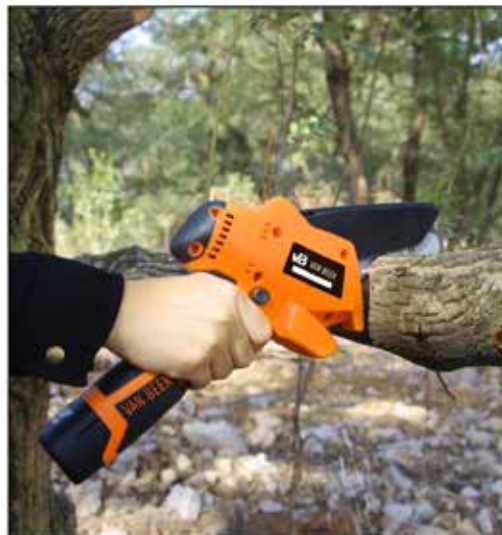
Aserrado de árbol