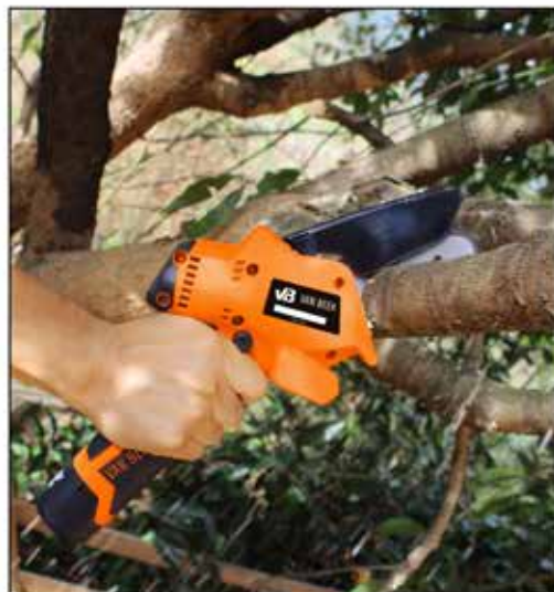
Poda de ramas de frutas