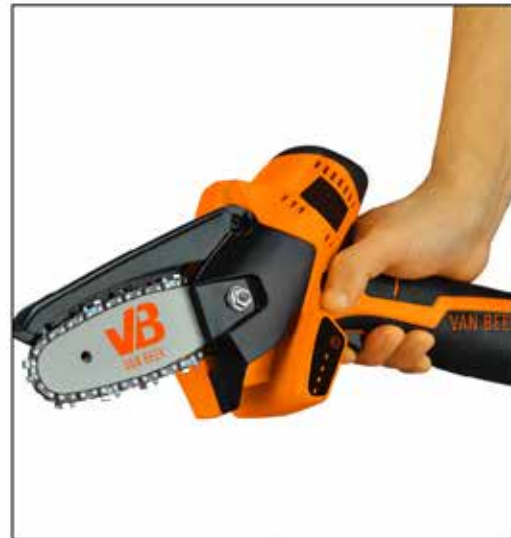
Pequeño y conveniente