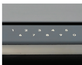
输入新的密码后按下START按钮