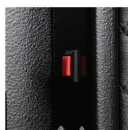
按下密码变更按钮