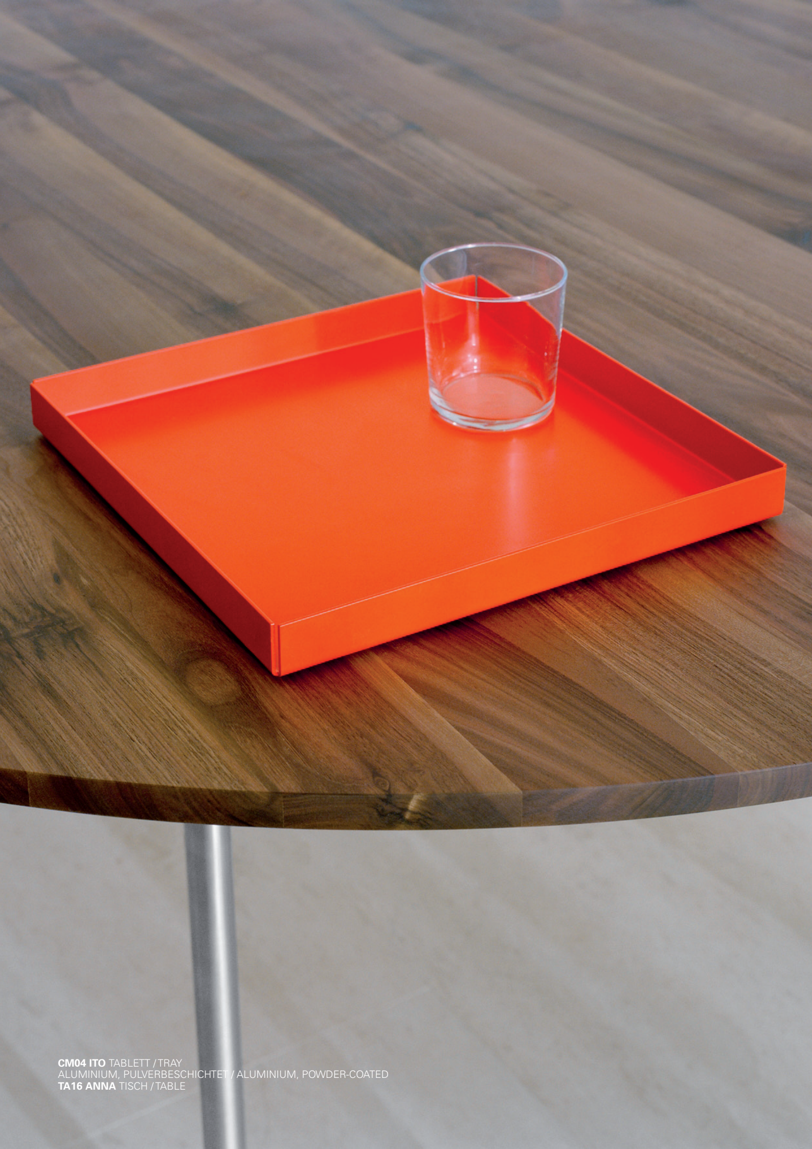
CM04 ITO TABLETT / TRAY ALUMINIUM, PULVERBESCHICHTET / ALUMINIUM, POWDER-COATED TA16 ANNA TISCH / TABLE