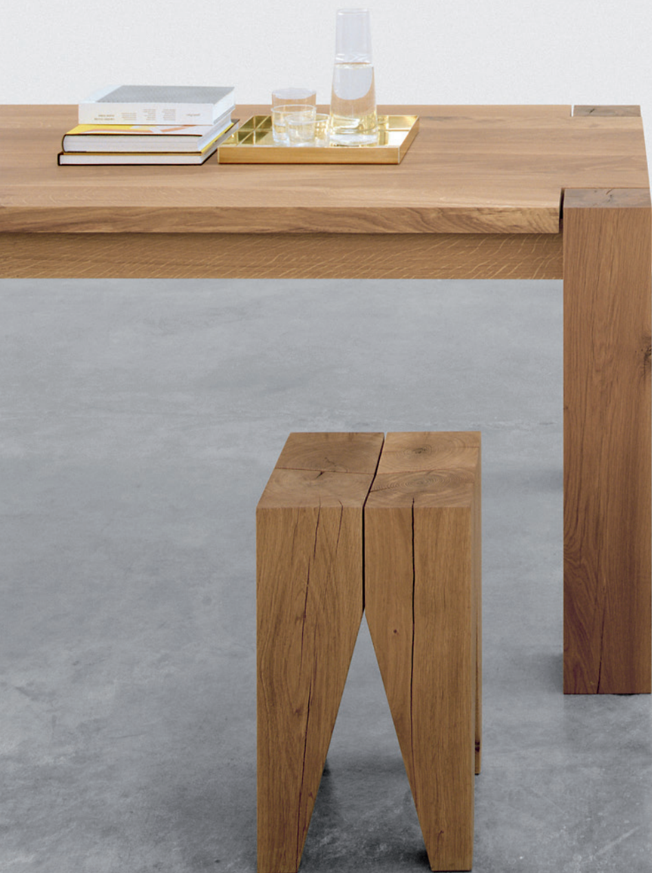
CM04 ITO TABLETT / TRAY MESSING / BRASS TA04 BIGFOOT™ TISCH / TABLE ST04 BACKENZAHN™ HOCKER / STOOL