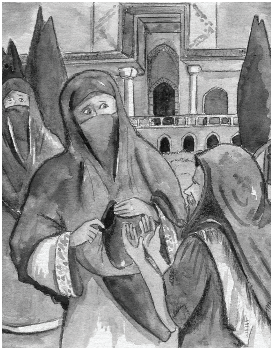
"בקשיש! בקשיש!" (= "נדכה! נדכה!") סלסל נסים בקולו כמנהג קבצני בגדד.

דינה סובבה את ראשה לאחור ונעצה מבט חד וארף בקבצן. ברגע הזה שמחה דינה מאוד על הרעלה שכפסה את פניה. אלו היו פניה גלויות היתה פאטמה מבחינה מיד בתורוון שהציף אותן. דינה הביטה באביה והנהנה קלות בראשה. נסים השיב לבתו מבט רב-משמעות והנהן אף הוא בראשו.