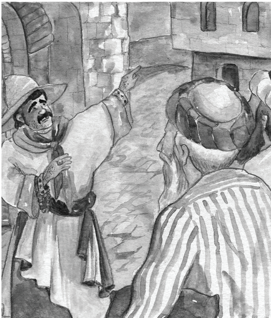
"לא הרחק מכאן, על חוף הנהר, נצבת ספינתנו..."