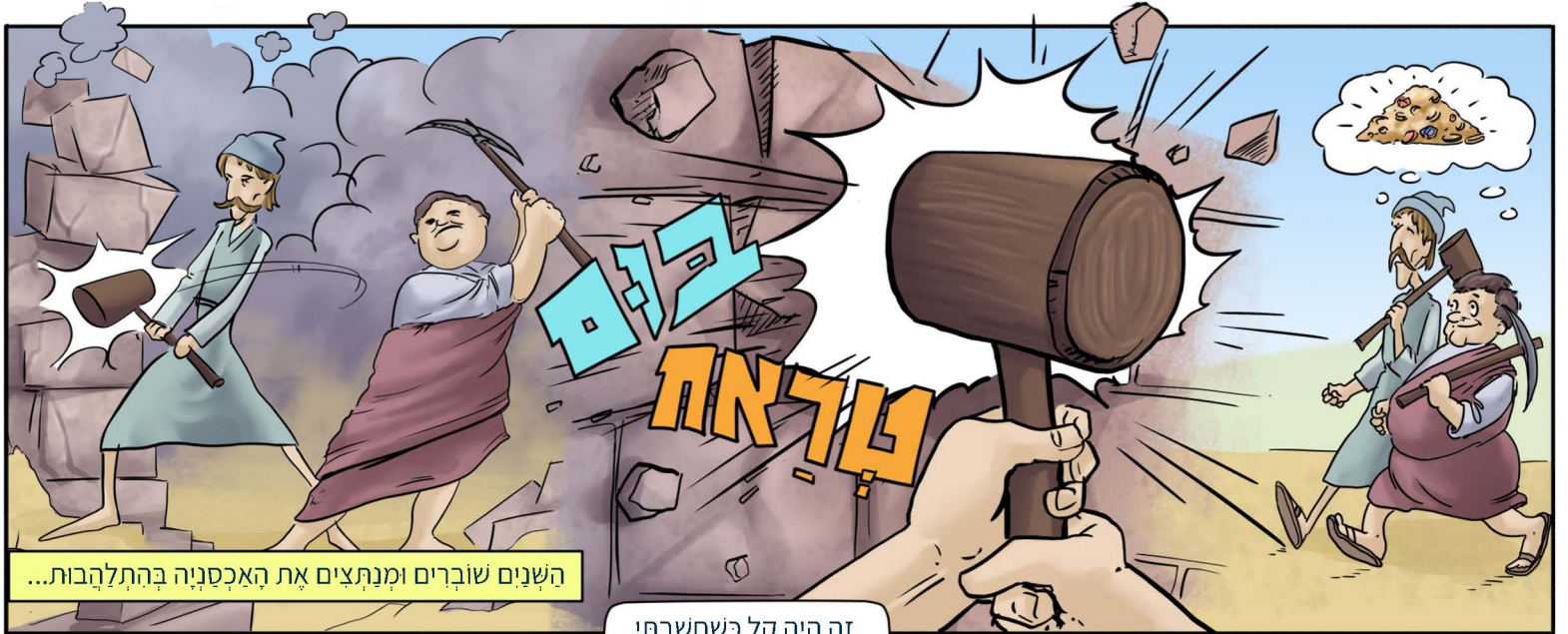
השנים שוברים ומנצחים את האכסניה בהתלהבות...