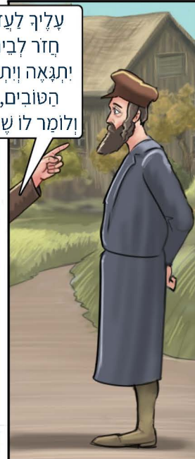
החסיד הזדרז ופרע את חובו של היהודי הנמק בבור כלאו, ומיד שם את פעמיו לעבר ביתו של יעקב הגביר.

עליך לעזר לו לחזר בתשובה. חזר לביתו, ובכל פעם שהוא יתגאה ויתפאר בפניך על מעשיו הטובים, עליך להפסיק אותו ולומר לו שעוד תדבר אתו על כך.