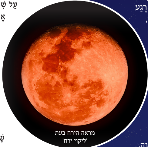
מראה הירח בעת 'ליקוי ירח'

כאשר הירח, כדור הארץ והשמש נמצאים בקו אחד, מטיל כדור הארץ צל על הירח והוא מאיר באור אדמדם עמום. תופעה זו קרויה "לקוי ירח". האור המועט מגיע בעקבות השתברות קרני השמש על שכבת האויר שמקיפה את כדור הארץ. לקוי כזה מתמשך כשעה וחצי - הזמן שלוקח לירח לצאת מאזור הצל שמטיל כדור הארץ. והוא יכול לחול רק בעת ירח מלא, ורק פעמים-שלוש בשנה.