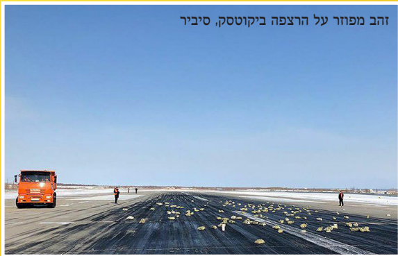
זהב מפוזר על הרצפה ביקוטסק, סיביר