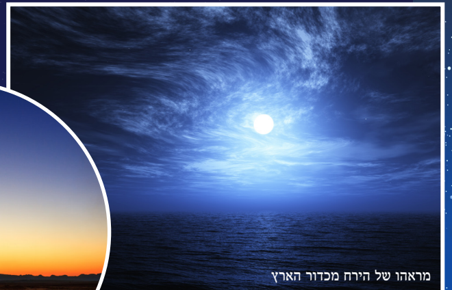
מראהו של הירח מכדור הארץ

אכן, הירח קטן בהרבה מן השמש, ואפילו מן כדור הארץ. בעוד הליכה על פני הקפו של הירח תתמשך על פני כמעט 11,000 קילומטר, הליכה על פני הקפו של כדור הארץ תארך מעט יותר מ-40,000