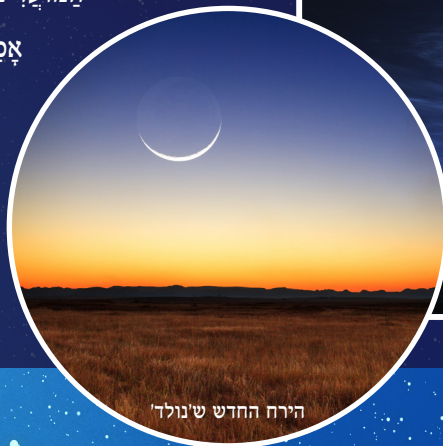
הירח החדש ש'נוולד'