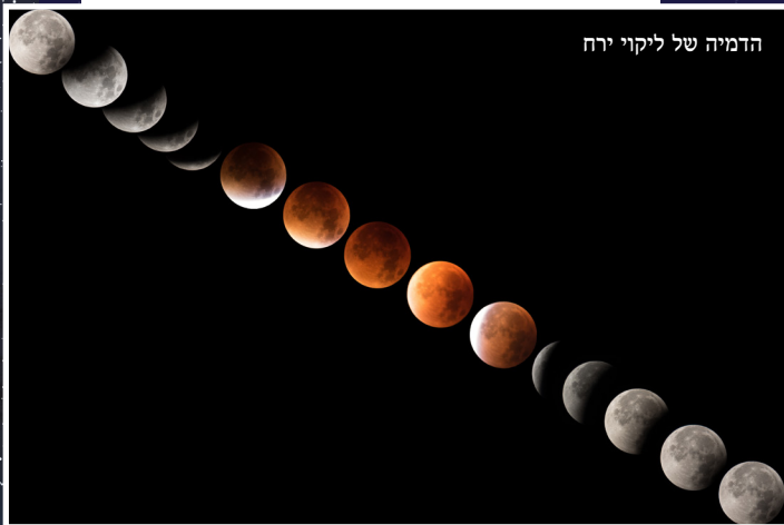
הדמיה של ליקוי ירח

פני הירח שנראים במבט חטוף עגלים וחלקים, נראים אפלו בכדור הארץ במבט מדקדק יותר, כשהירח מלא - מחרצים ומלאי גבשושיות. בעזרת שמוש בטלסקופ, נתן לראות כי ממש כמו כדור הארץ שלנו, פני הירח בעלי גאיות ובקעים, הרים ורכסים. מכתשים רבים ממלאים את פניו כחוצצא מפגיעת אסטרואידים, שביטים וסלעים שונים. המכתש הגדול ביותר קרוי "אגן איטקו בקטב הדרום", ועמקו כ-13 קילומטר. לאזורי פגיעה