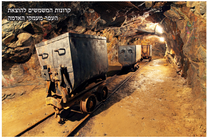
קרונוט המשמשים להוצאת העפר-מעמקי האדמה

מִסְתַּבֵּר, כִּי תֵא מְטֵעֵן שֶׁל מְטוֹס הַנוֹשֵׂא מְטֵעֵן יָקָר בְּמִיחָד הַתְּפָרָק בַּעַת הַהִמְרָאָה וּפָזָר אֶת מְטֵעֵנוּ בְּאִזּוֹר שְׂדֵה הַתְּעוּפָה וְהָעִיר הַסְּמוּכָה. עֲשָׂרָה טוֹן שֶׁל זָהָב, פְּלִטִינָה וְיִהְיוּמִים נִחְתוּ בְּמִפְתִּיעַ עַל הַתּוֹשְׁבִים הַמְּאֻשְׂרִים. שׁוּי הַמְּטֵעֵן, הַשִּׁיָּד לְחִבְרַת הַכְּרִיָּה צ'וֹקוּטְקָה, עוֹמֵד עַל 21 מִלְיָרְד רוּבֵל - בְּעֵרָה 366 מִלְיוֹן דוּלָר אַמְרִיקָאִי. צוּחֵי חֲפוּשׁ הוֹחֲשׂוּ לְמָקוֹם, וּמְנַסִּים לְאַתֵּר אֶת הַכְּבֵדָה הַיְקָרָה.