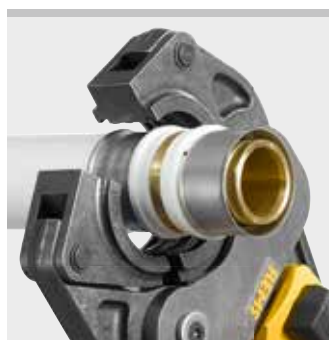
REMS tenaza de prensar (S)