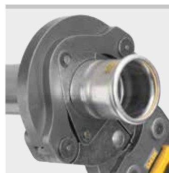
REMS anillo de prensar (PR-3S)