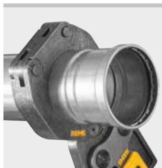
REMS anillo de prensar (PR-3B)