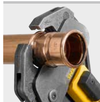
REMS tenaza de prensar (4G)