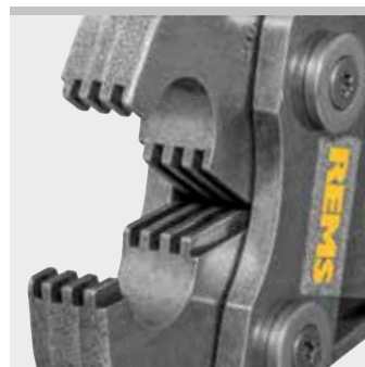
Tenaza de prensar con dientes Patent EP 2 027 971