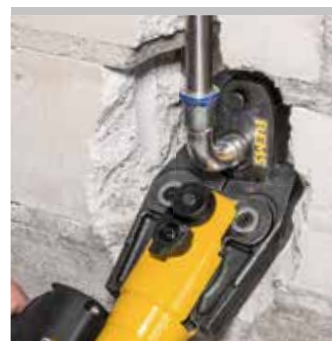
REMS anillo de prensar 45° (PR-2B) Patent EP 2 774 725