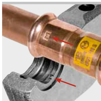
Ejemplo REMS Tenaza de prensar M: Impresión "M" en accesorio prensado para la identificación conforme a la EN 1775:2007