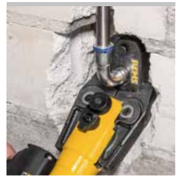
REMS anillo de prensar 45° (PR-2B) Patente EP 2 774 725