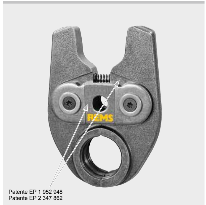
Patente EP 1 952 948 Patente EP 2 347 862

Con esta identificación REMS cumple las recomendaciones de la Norma Europea EN 1775:2007 en la instalación de sistema de prensado para gas.