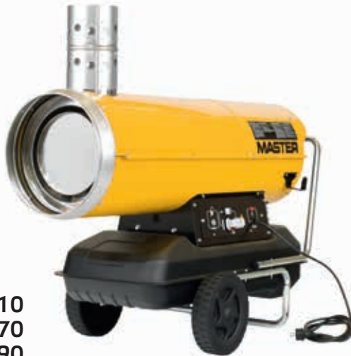
BV 110 BV 170 BV 290