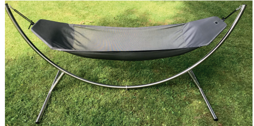
SLIMLINE hängt perfekt am Edelstahlständer LUNO