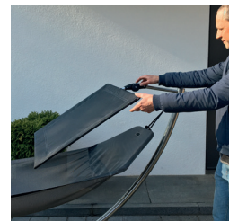
Dach tief geneigt