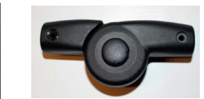
Abb. oben: Knick-Gelenk