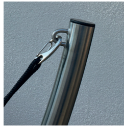
Ständer ohne Hülse