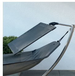
Dach tief geneigt