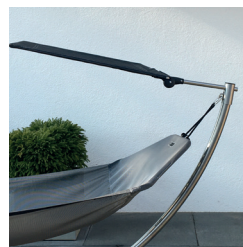
Dach leicht hoch geneigt