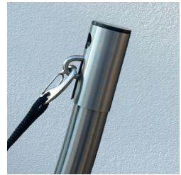
Ständer mit Hülse