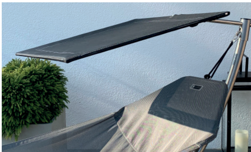
Abgebildet ist der Ständer LUNO mit der Hängematte SLIMLINE

geeignet für Hängematten-Ständer LUNO und LAZY