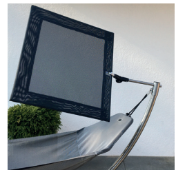
Dach axial gedreht